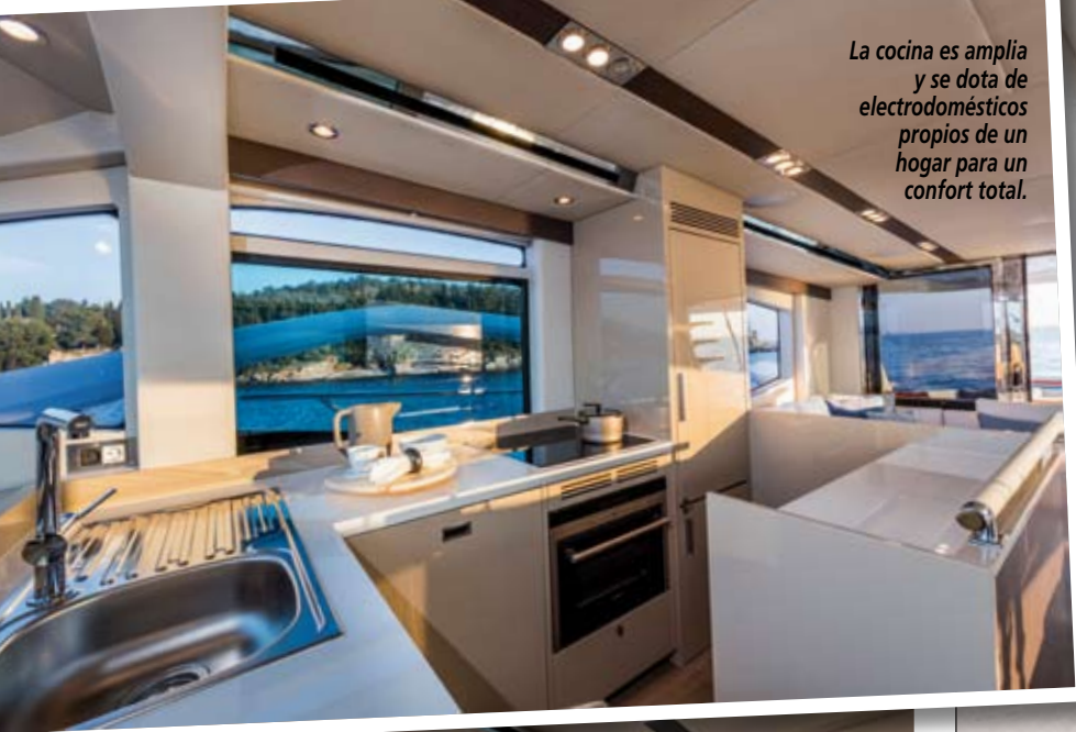
La cocina es amplia y se dota de electrodomésticos propios de un hogar para un confort total.