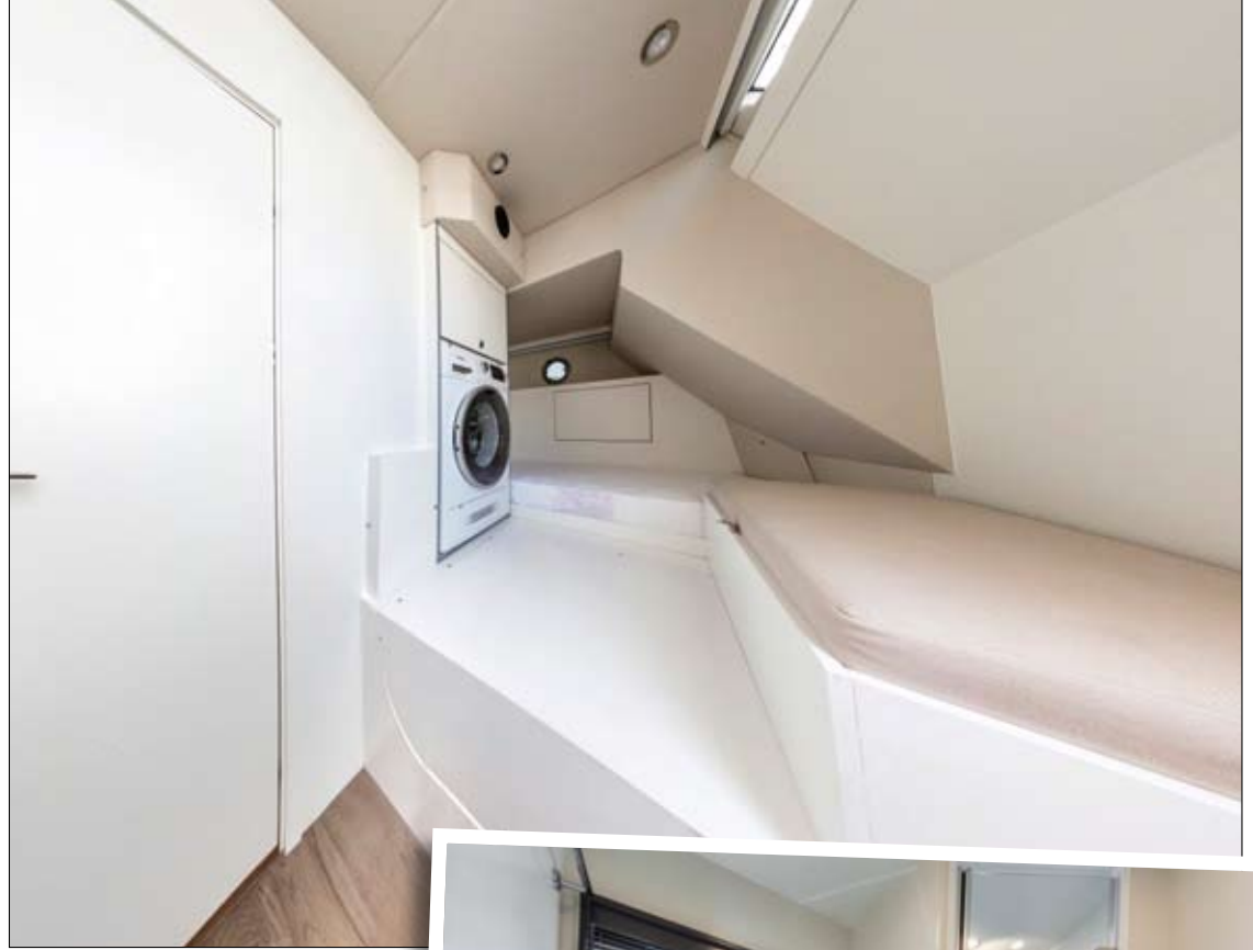
La zona de tripulación se sitúa en el extremo de popa, junto a la cámara de motores e integra también la lavadora.

El alojamiento consta de tres camarotes y tres aseos y destina la sección central a un camarote a manga completa para el armador. Escoltado por dos amplias superficies acristaladas al nivel del mar, éste cuenta con una cama doble en isla transversal y un sofá de dos plazas, además de un aseo privado con ducha separada e inodoro eléctrico. De forma similar, la cabina VIP de proa incluye también una cama doble en isla y un aseo privado, mientras que para el tercer camarote, situado a babor, se optaba por dos camas individuales y un acceso independiente al aseo diurno. Asimismo, el extremo trasero puede dedicarse a zona de tripulación que ofrecerá dos camas individuales y un aseo completo junto a la cámara de motores. ■■■ H.G.