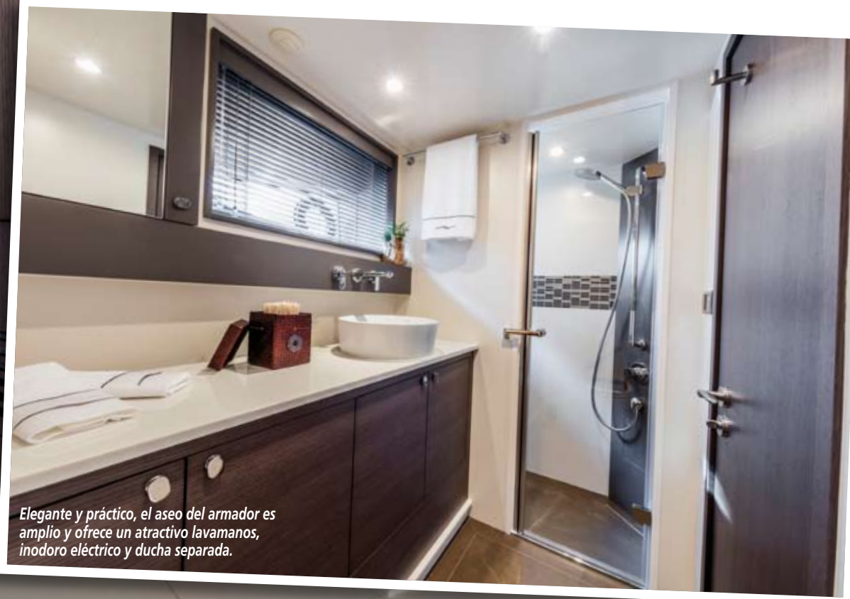
Elegante y práctico, el aseo del armador es amplio y ofrece un atractivo lavamanos, inodoro eléctrico y ducha separada.