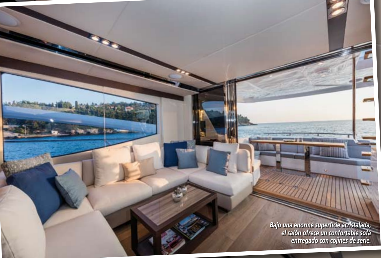
Bajo una enorme superficie acristalada, el salón ofrece un confortable sofá entregado con cojines de serie.