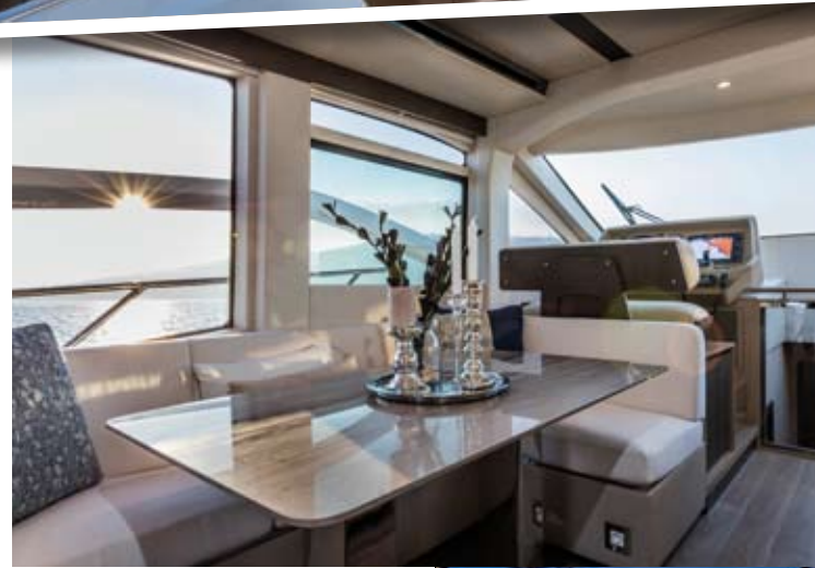
La dinette dispone de su propia zona, aunque comparte estancia con el salón y la cocina, prueba de la vocación social de su distribución.