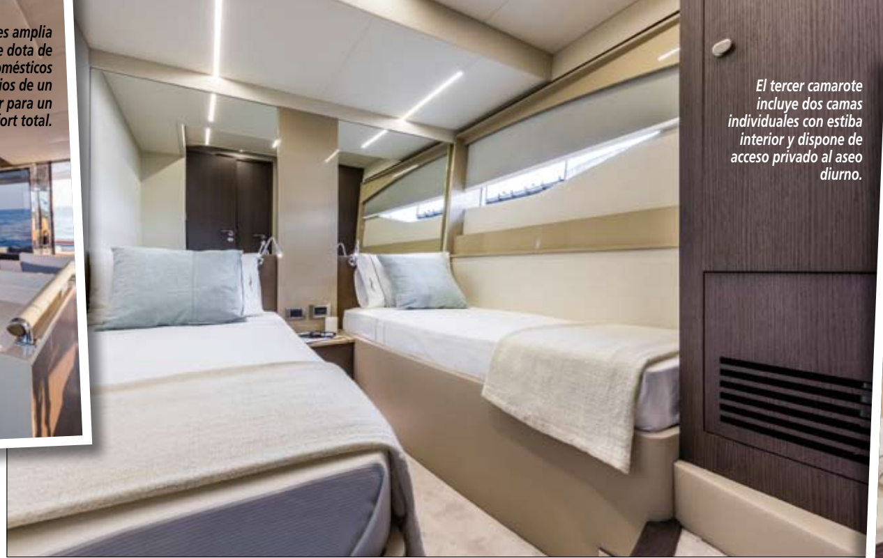
El tercer camarote incluye dos camas individuales con estiba interior y dispone de acceso privado al aseo diurno.