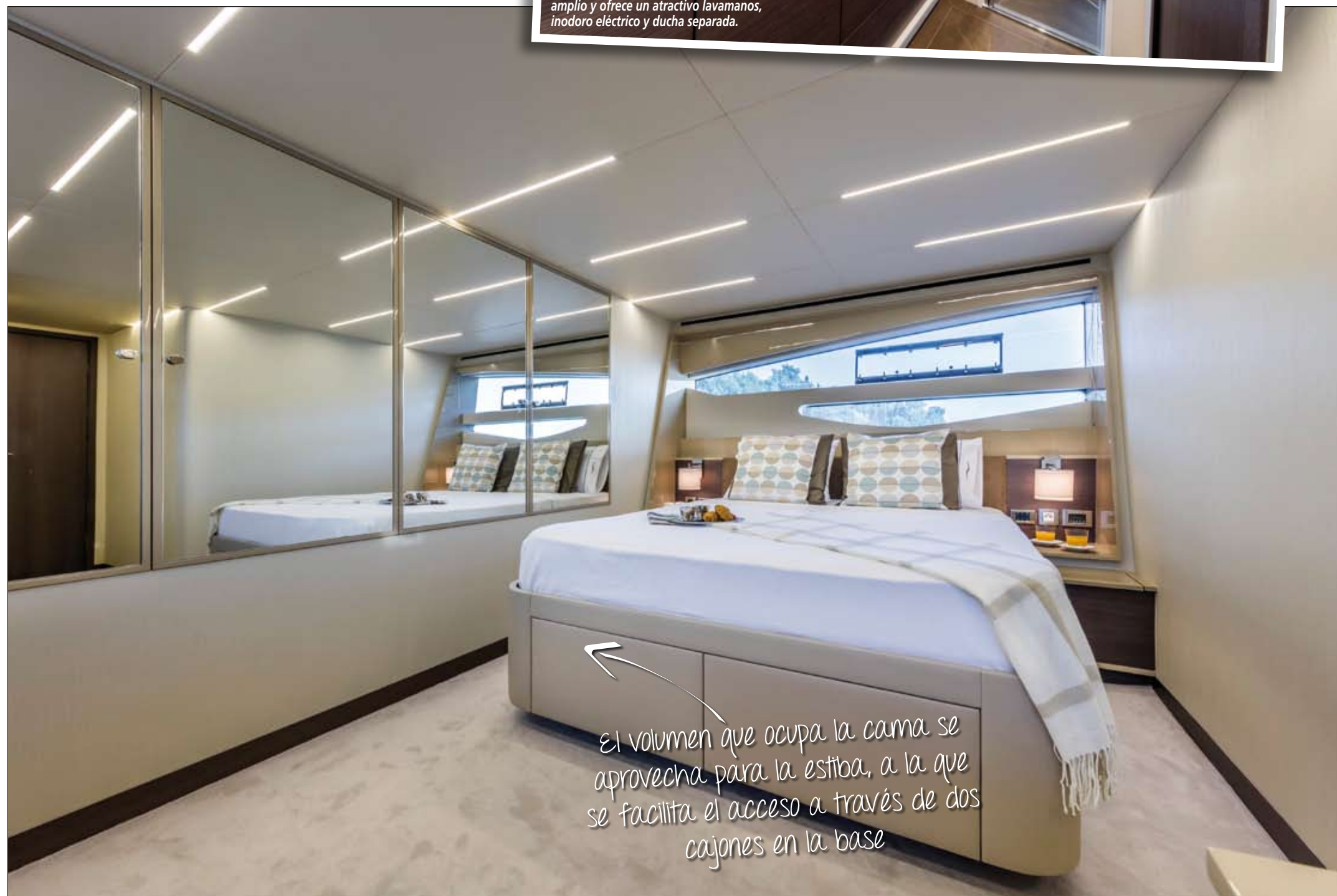
El volumen que ocupa la cama se aprovecha para la estiba, a la que se facilita el acceso a través de dos cajones en la base